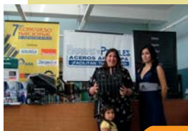
Ceremonia de calificación Chiclayo