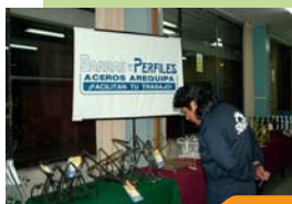
Exhibición de revisteros Arequipa

Participa y aumenta las posibilidades de que tu departamento sea una de las sedes y así podrás presenciar en vivo y en directo la ceremonia de calificación y el sorteo de fabulosos premios. Pásale la voz a tus familiares y amigos para que también participen del concurso. Que no se queden atrás y apoyen a tu ciudad. ➤