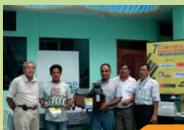
Ceremonia de calificación Iquitos