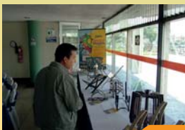
Exhibición de revisteros Lima