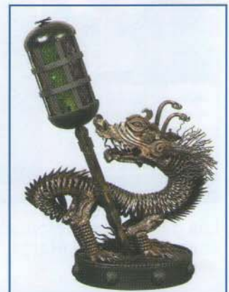
Trabajo presentado al 2 do Concurso Nacional de Cerrajería

Las personas que han podido admirar sus trabajos durante las exhibiciones, son testigos de su talento, razón por la cual, ha logrado vender recientemente a una empresa dedicada a la exportación, ocho réplicas de la lámpara que presentó en el 2 do Concurso Nacional de Cerrajería.