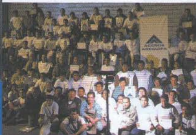
Fueron más de 500 personas las que participaron en el 3 er Seminario Internacional de Herrería

También se mostró el martillo de pedal y su funcionamiento.