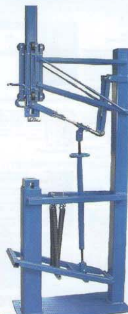
Martillo Mecánico construido por Brent Bailey

Durante el transcurso del año 2006 las Jornadas de Cerrajería contemplarán el uso de este equipo.