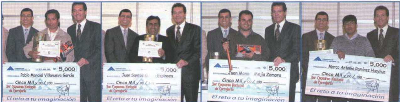
Felices ganadores del 3er Concurso Nacional de Cerrajería, recibiendo sus premios en la ceremonia de premiación

Una vez más el concurso fue un despliegue de talento y creatividad, donde artistas, maestros cerrajeros, soldadores y una diversidad de personas de distintos oficios, compitieron para alcanzar los mejores resultados.