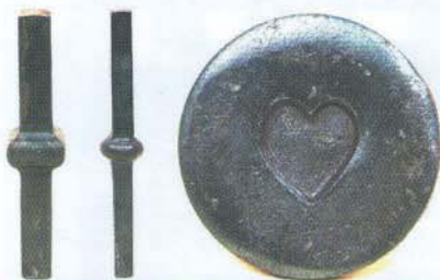
Algunos de los diseños y estampados que se realizaron con el Martillo Mecánico

Muchas veces pensamos que las buenas soluciones tiene por lo general respuestas complicadas, que se encuentran reservadas para los ingenieros o profesionales en la materia. Pero en realidad la esencia de la innovación radica en hacer lo complicado fácil y lo costoso accesible. Si queremos mejorar la infraestructura de nuestros negocios no necesariamente requerimos de grandes inversiones, pero si de mucha imaginación.