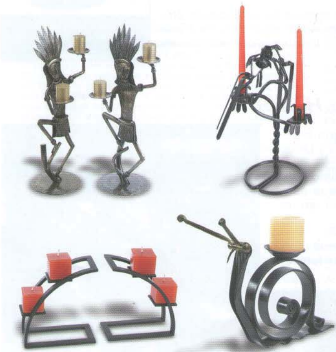
Trabajos ganadores del 3er Concurso Nacional de Cerrajería